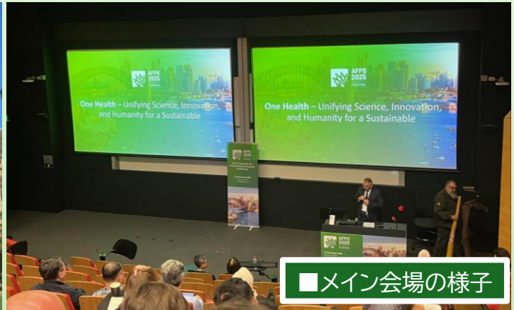
■メイン会場の様子