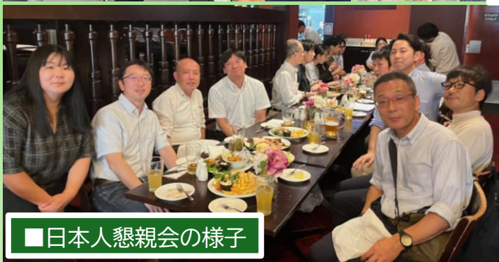
■日本人懇親会の様子