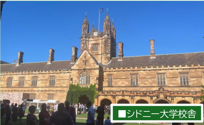
■シドニー大学校舎

One health Unifying medicine, nature, and technology