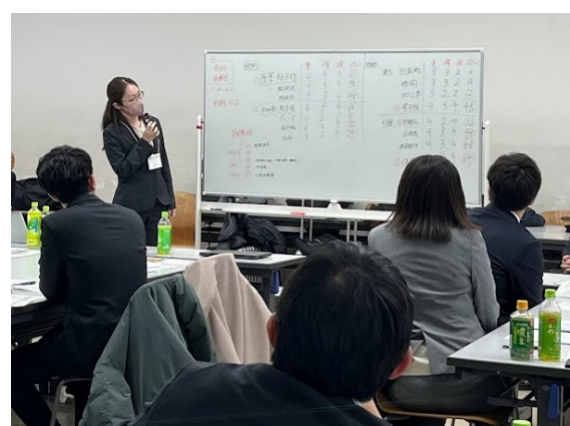
結果発表も真剣に聴きました！