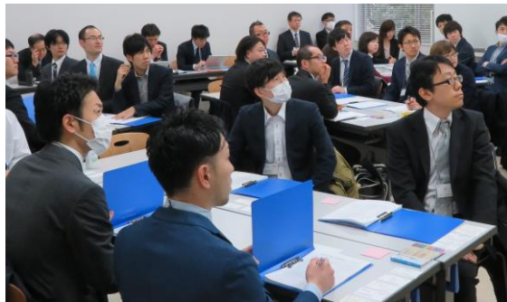
真剣に講義を聞きました！