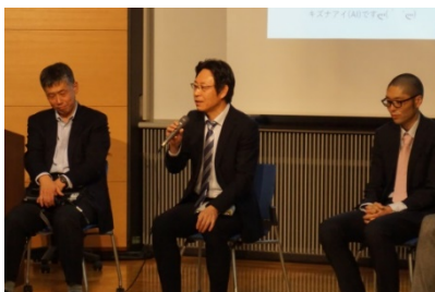
ラウンドテーブルセッションでの議論