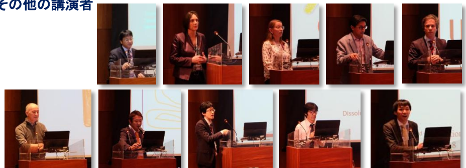
グラビア作成: 松井一樹 (沢井製薬)