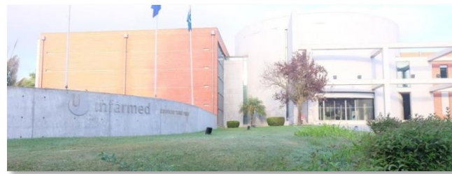
Infarmed (ポルトガル医薬品規制当局)