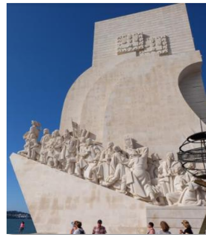
発見のモニュメント

メインテーマに、生物薬剤学と経口製剤の融合を意味する「Biopharmaceutics meets Galenics」を据え、効率的な経口製剤開発のための理論と技術およびその規制に関する最新の話題が提供・議論されました。