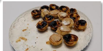
ポルトガル名物 パスタ・デ・ナタ(エッグタルト)