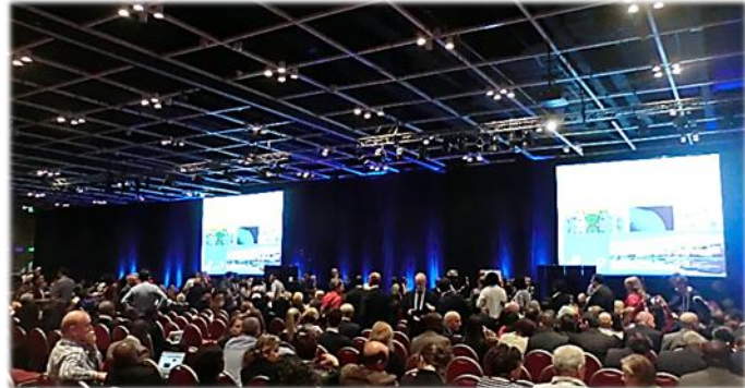
世界94カ国約2000人が参加しました