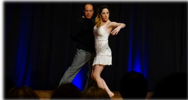
アルゼンチンタンゴの華麗な舞台