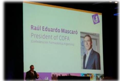
COFA (The Confederación Farmacéutica Argentina) のRaúl Mascaró会長挨拶