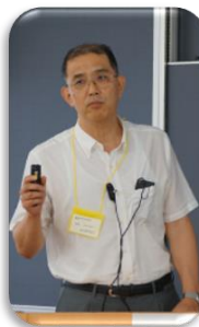
特別講演・合田先生