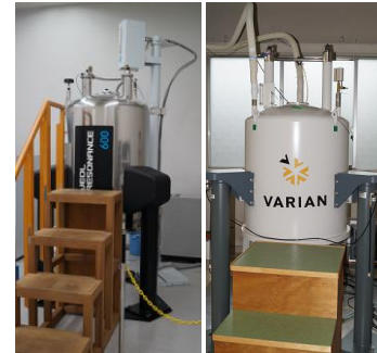
NMR & MRI装置