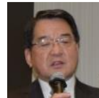
岡野光夫先生 東京女子医科大学 先端生命医学 研究所